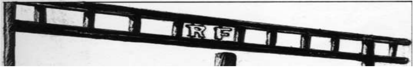
Kkrist Mirror "Tsiganes"

Après la défaite de juin 1940, l'occupant donne l'ordre d'ouvrir les camps pour y interner les Tsiganes. L'ordre est allemand, la réalisation est française, du ressort de l'administration de Vichy