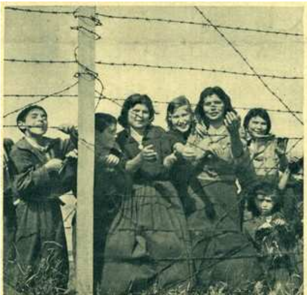
Bien entendu, les cigarettes ne sont pas prévues pour les gitanes, qui pourtant les adorent. Derrière le grillage, elles interpellent le passant pour en avoir.

Quelque 3 000 à 4 000 Tsiganes séjournèrent ou transitèrent par le camp de Montreuil-Bellay considéré comme ayant été le plus important de France pour cette population nomade.