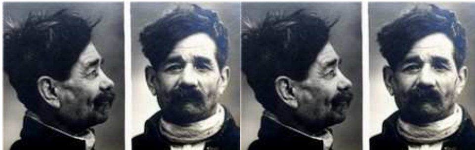
Archives départementales des Charentes-Maritimes 20 W1

Art. 8. Le carnet anthropométrique porte les nom et prénoms, ainsi que les surnoms sous lesquels le nomade est connu, l'indication du pays d'origine, la date et le lieu de naissance, ainsi que toutes les mentions de nature à établir son identité.