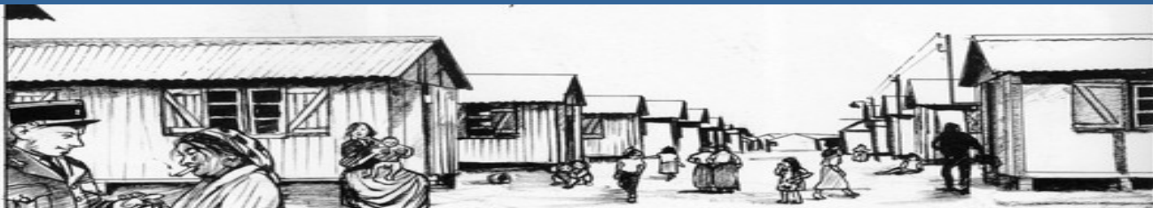
Kkryst Mirror « Tsiganes »

5 camps se trouvaient en zone libre (Argelès-sur-Mer, Le Barcarès, Rivesaltes, Lannemezan et Saliers), 25 camps en zone occupée. Différents témoignages et documents d'archives indiquent que des nomades ont connu également à titre individuel ou en famille d'autres camps comme ceux de Noé, Agde, Nexon, Fort Barraux.