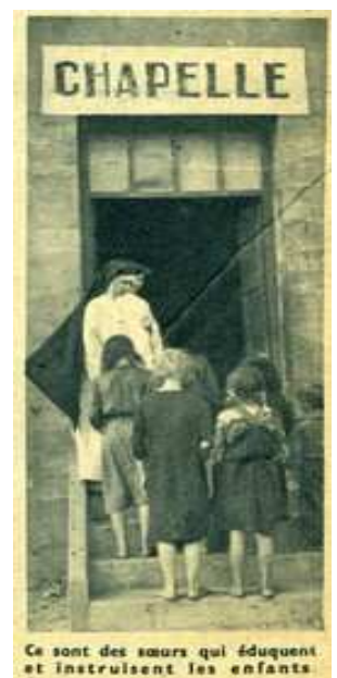
Ce sont des sœurs qui éduquent et instruisent les enfants.

Une stèle rappelant ces événements a été inaugurée sur le site du camp le 16 janvier 1988. Ce fut la première en France pour un ancien camp de « nomades ». Les autorités sollicitées pour participer à son financement ont alors toutes refusé.