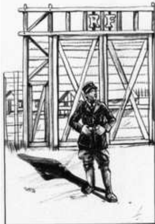
Kkrist Mirror "Tsiganes"

Les Tsiganes d'Alsace-Lorraine sont les premières victimes de l'occupant qui les expulse, dès juillet 1940, vers la zone libre où ils sont progressivement internés dans les camps d'Argelès-sur-Mer, Barcarès et Rivesaltes avant d'être transférés en novembre 1942 dans le camp de Saliers (Bouches-du-Rhône)