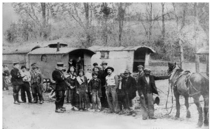
Contrôle des carnets anthropométriques 1920

Ce contrôle s'accroît avec la création des brigades mobiles de police judiciaire (les fameuses « brigades du Tigre » créées en 1907 par Clemenceau), dont la fonction est la surveillance du territoire et des frontières. Parmi leurs missions, le contrôle des nomades qui se concrétise par le fichage sur le mode du système anthropométrique d'Alphonse Bertillon. Elles procèdent à des mensurations, photographient, prennent les empreintes digitales des personnes, y compris des enfants.