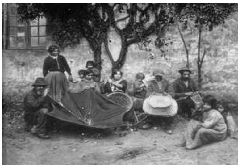
BDIC PARIS casier 8

Les Tsiganes arrêtés à l'intérieur ou à proximité des territoires reconquis d'Alsace et de Lorraine sont dirigés à partir de mars 1915 vers des centres de triage, puis internés dans des camps principalement situés dans le Midi de la France avant d'être regroupés au « dépôt surveillé de Crest », près de Valence dans la Drôme.