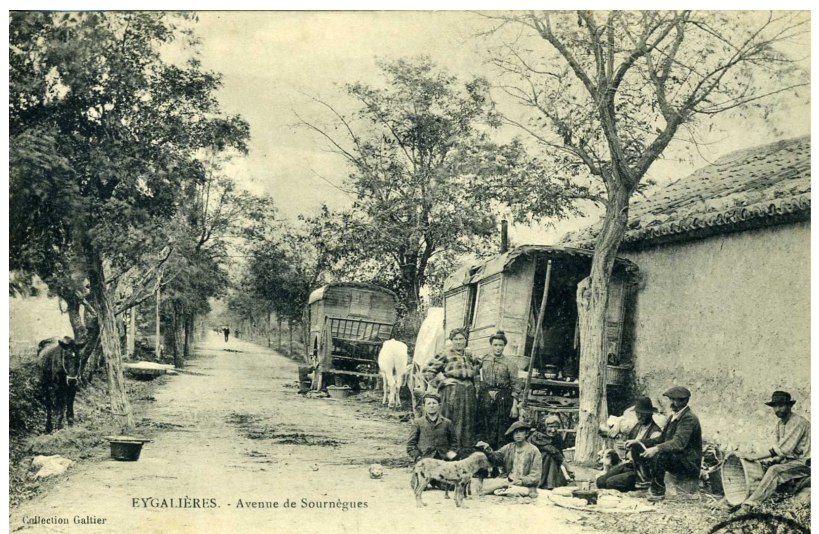
Eygalières 1914

En vigueur jusqu'en 1969, cette loi a régi la vie des nomades et les a relégués dans une position de citoyens de seconde zone, tenus à faire viser, à chacun de leurs déplacements, des papiers spécifiques portant leur signalement anthropométrique. Abrogée en 1969, elle fut remplacée par une loi, toujours en vigueur, qui ne constitue qu'un assouplissement des dispositions antérieures.