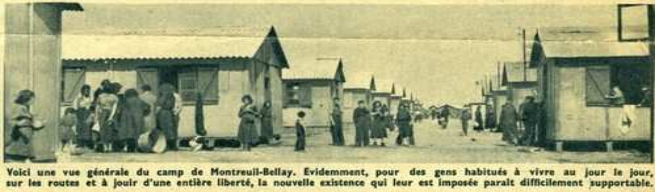
Voici une vue générale du camp de Montreuil-Bellay. Evidemment, pour des gens habitués à vivre au jour le jour, sur les routes et à jouir d'une entière liberté, la nouvelle existence qui leur est imposée paraît difficilement supportable.

Camp Montreuil - Journal Toute la vie 29 juin 1944