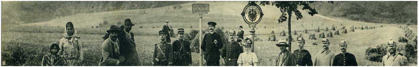
Vic-Arracourt (54) à cheval sur la frontière vers 1912

Discours sécuritaires et campagnes de presse xénophobes stigmatisent les « nomades »